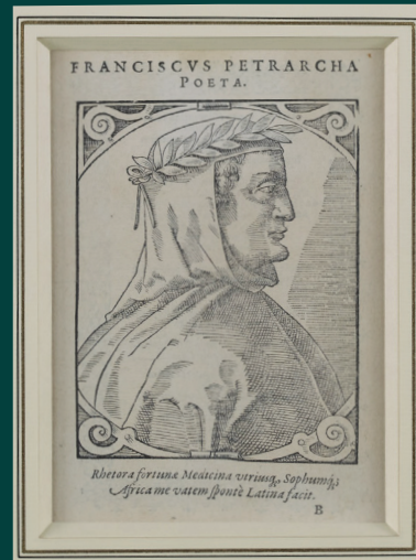
Francisco Petrarca poeta. estampe, XVIIe siècle, Musée-bibliothèque François Pétrarque, inv. 47

François Pétrarque (1304-1374) est né en Toscane en 1304. L'enfant poète quitte l'Italie avec sa famille pour le Vaucluse où il découvre, dès l'âge de 7 ans, la source de la Sorgue puis adulte, il y séjourne régulièrement jusqu'en 1353. Cet érudit, passionné d'Antiquité romaine, parcourt l'Europe sans répit en un réseau de protection auprès de puissantes familles, de souverains ou amis. En 1341 à Rome, au sommet de sa gloire, il est couronné roi des poètes. Ses si nombreux voyages sont toujours ponctués par des retours à sa retraite heureuse de Fontaine-de-Vaucluse. Le poète, l'amant de Laure, le moraliste, l'historien ont nourri la figure légendaire du premier homme de lettres universel.