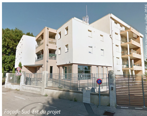
Façade Sud-Est du projet