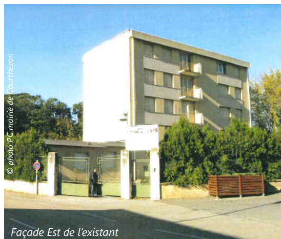
Façade Est de l'existant