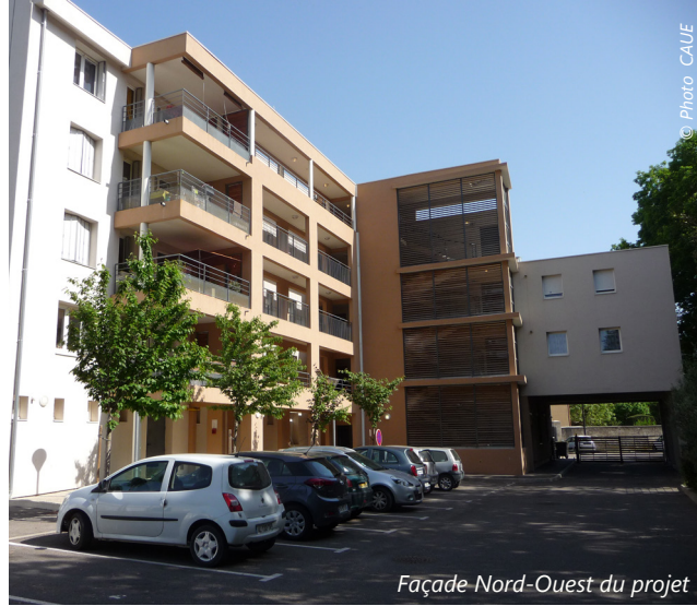
Façade Nord-Ouest du projet

Description du projet : 14 logements locatifs sociaux (8 logements dans la partie existante et 6 logements dans la partie neuve) et une maison communale de services publics aménagée en rdc.