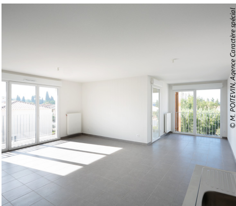
© M. POITEVIN, Agence Caractère spécial