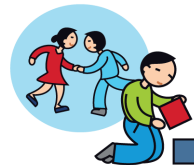
Ne joue pas avec les autres enfants