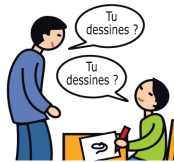
Utilise le langage de façon écholalique