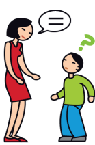
A du mal à comprendre et à se faire comprendre