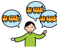
Parle de façon incessante sur un sujet particulier