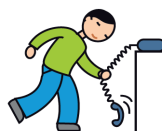
Utilise les objets de façon atypique