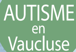
Illustration réalisée par Olivier CAYUELA