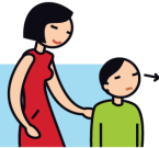
Manque de contact oculaire