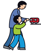
Indique ses besoins en utilisant la main d'un adulte