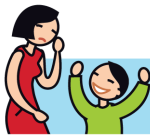
Rit de façon inappropriée