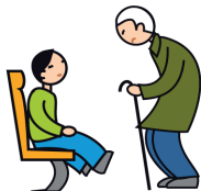
Comprend mal les conventions et les règles sociales