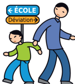
N'apprécie pas les changements